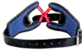
Ledergürtel CA AerGO®