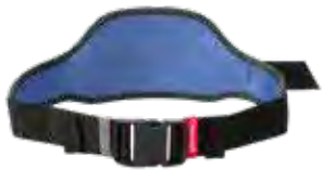
Komfürtgürtel Super [Basic, 2F]