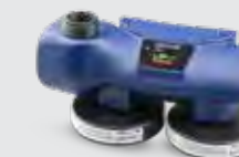
Chemical 2F Asbest