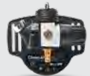
Pressure Flow Master