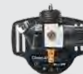
Pressure Flow Master