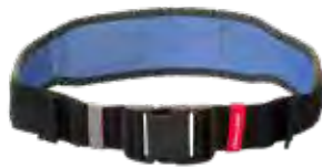
Komfürtgürtel Standard [Basic/Pressure]