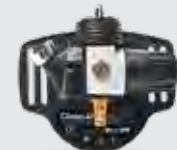
Pressure Flow Master