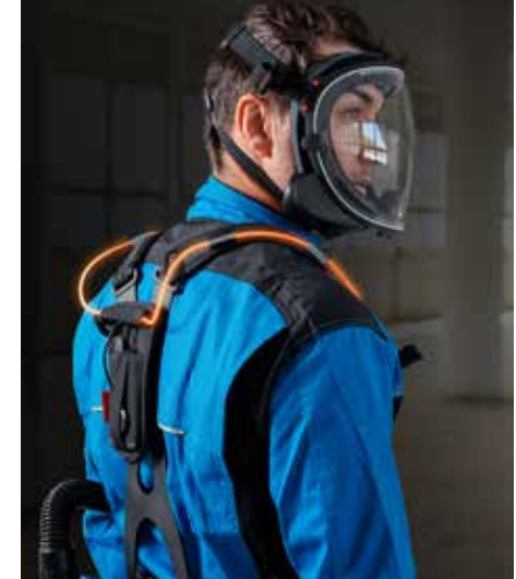
Art. Nr. 710050

...Weitere Details finden Sie auf Seite 95.