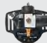
Pressure Flow Master