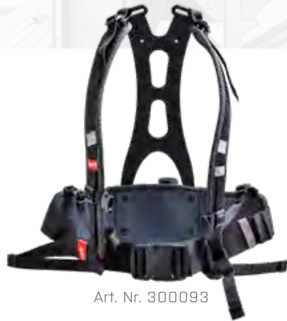
Art. Nr. 300093