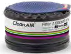
Art. Nr. 300368