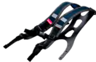
Gepolstertes Komfürtgurtzeug für CA Chemical 2F/3F