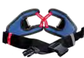
Komfürtgürtel CA AerGO®