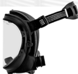
Art. Nr. 729100