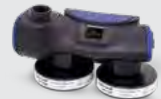
Chemical 2F Ex