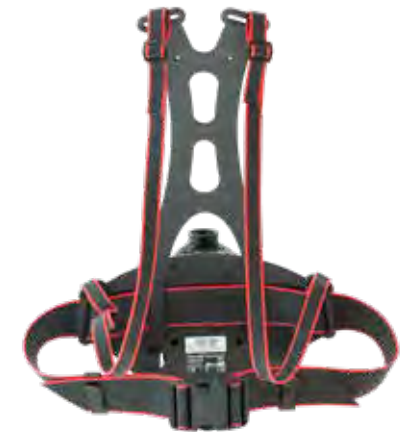
Dekontaminierbares Gurtzeug PVC – 3F