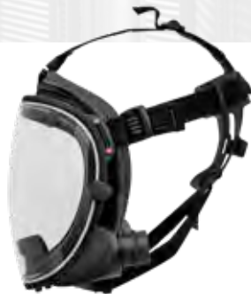
Art. Nr. 720345