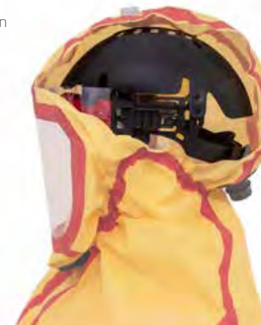
Varicap und CA-10