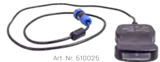
Art. Nr. 510025

ihrer Klasse ...Weitere Details finden Sie auf den Seiten 36 – 39.