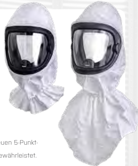
Art. Nr. 720360