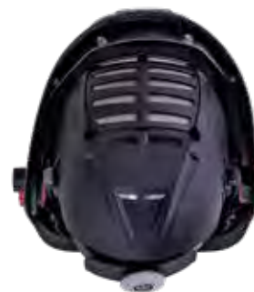
Varicap und Verus