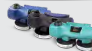
Chemical 2F Chemical 2F Ex MedicAER