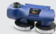
Chemical 2F Asbest