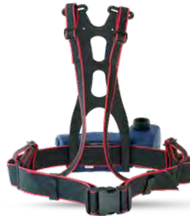
Dekontaminierbares Gurtzeug – 2F